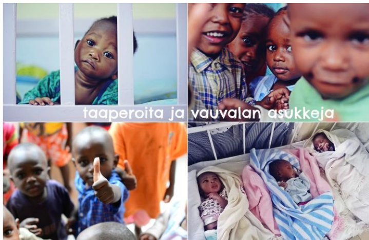
taaperoita ja vauvalan asukkeja