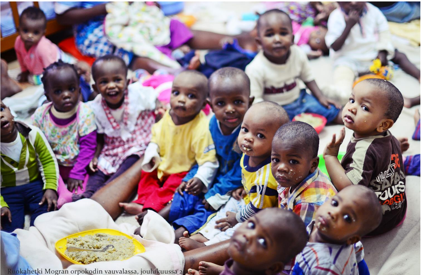
Ruokahetki Mogran orpokodin vauvalassa, joulukuussa 2015