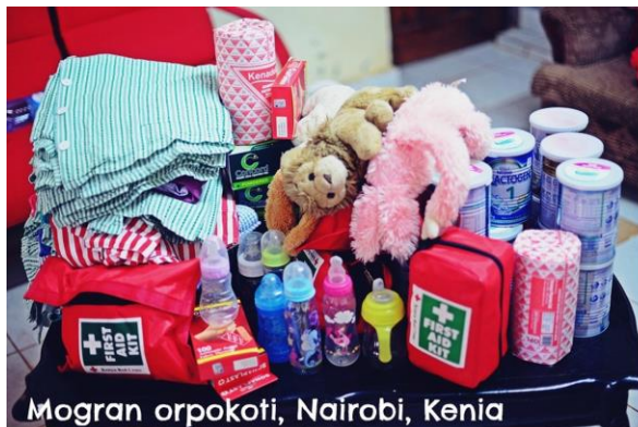
Mogran orpokoti, Nairobi, Kenia

Joulukuisesta matkasta Nairobiin voisi kirjoittaa kokonaisen novellin, mutta yritetään pysyä matkan pääpiirteissä ja antaa myös kuvien puhua puolestaan. Matka oli tietenkin omarahoitteinen ja tarkoituksena oli viettää aikaa sekä orpokodilla että slummikoululla, tuoda tarvikkeita ja jutella tulevista projekteista. Kaikki matkan tavoitteet saavutettiin täydellisesti. Oli inspiroivaa, sydäntä lämmittävää ja mieltä mullistavaa saada olla taas paikan päällä, näkemässä Asanten kädenjälki ja kaikki se aito ilo, mitä meidän toiminta saa aikaiseksi. Samalla matka oli muistutus, että paljon on vielä työsarkaa jäljellä. Siksi meillä on Asante.