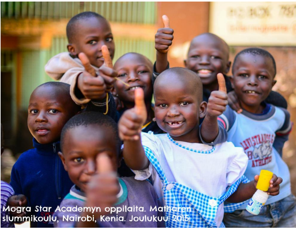
Mogra Star Academyn oppilaita. Matharen slummikoulu, Nairobi, Kenia. Joulukuu 2015